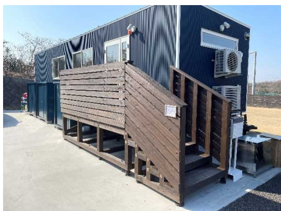
Basara Village Green (神戸市) (②屋外木質化)