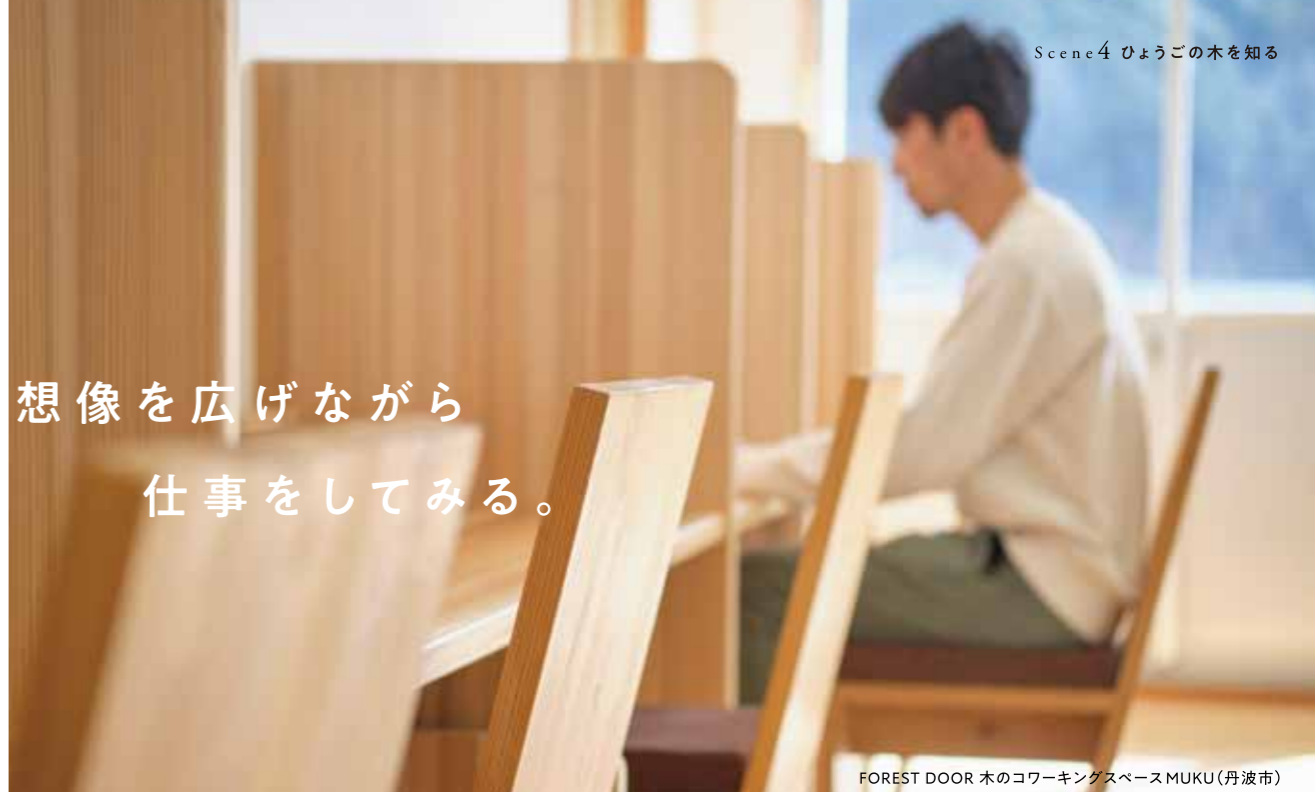
FOREST DOOR 木の coworking space MUKU(丹波市)