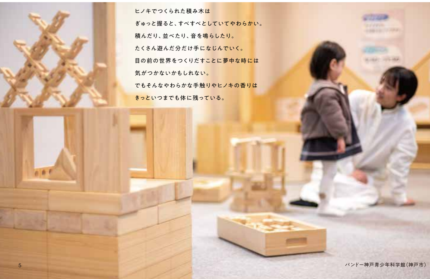
バンドー神戸青少年科学館(神戸市)

ヒノキで作られた積み木は ぎゅっと握ると、すべすべとしていてやわらかい。 積んだり、並べたり、音を鳴らしたり。 たくさん遊んだ分だけ手になじんでいく。 目の前の世界をつくりだすことに夢中な時には 気がつかないかもしれない。 でもそんなやわらかな手触りやヒノキの香りは きっといつまでも体に残っている。