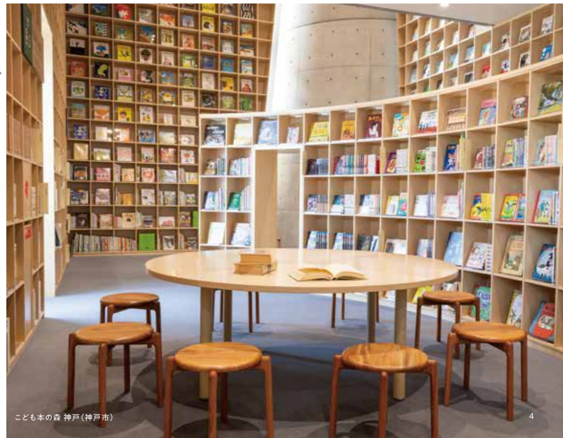
こども本の森 神戸(神戸市)

子どものための図書施設に並ぶのは 神戸の並木道を彩っていた ケヤキでつくられた子どものための椅子。 木作家が込めたのは、いのちへの思い。 育った木は切って使うことで 再びいのちを吹き込まれる。 そしていのちの連なりは 未来へつながっていく、と。 変化し続ける世界の片隅で 壮大な循環に腰をかけ、 ページをめくる一瞬。